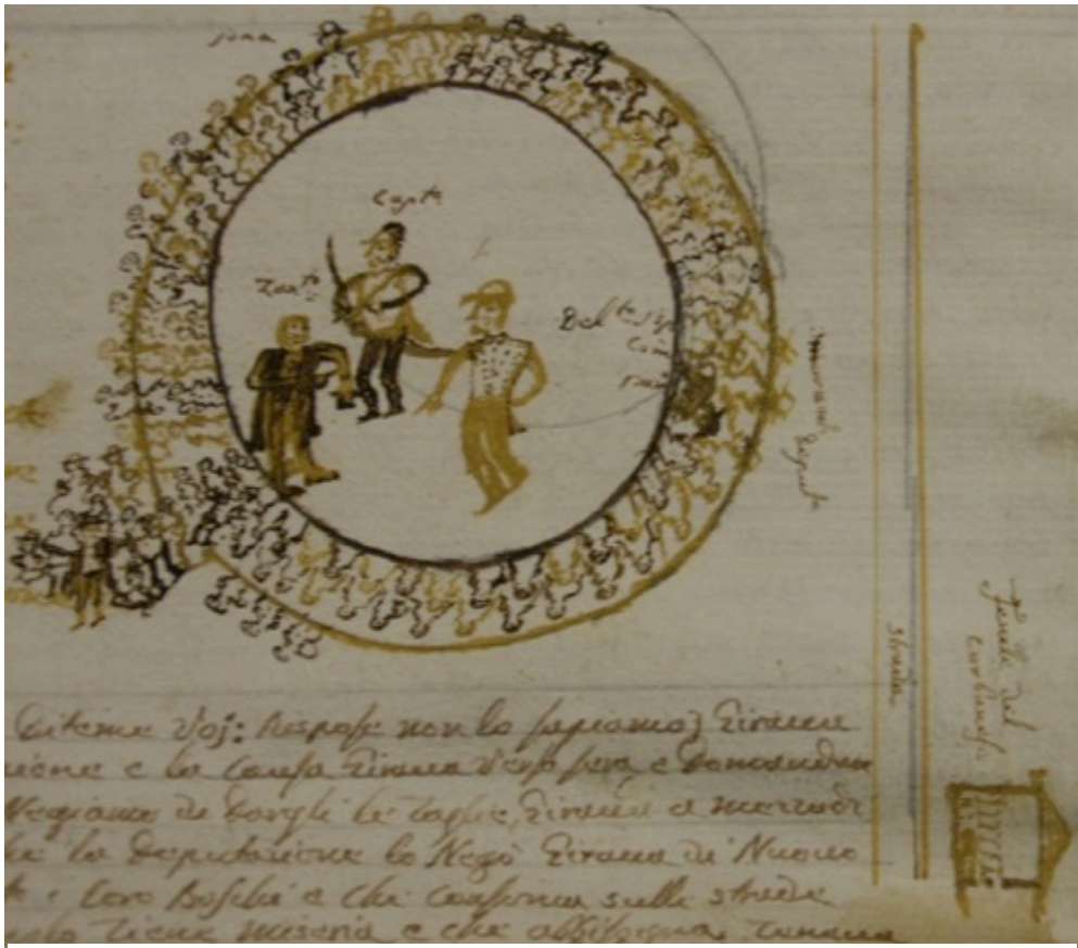
Figura 7. Il delegato provinciale incontra la popolazione del Comelico durante la rivolta del maggio 1840.