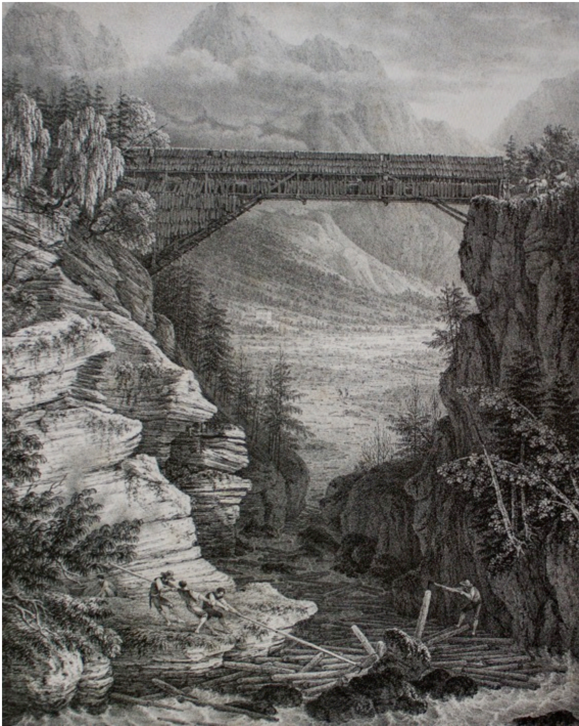
Figura 3. Le prime fasi del trasporto del legname nell'alto bacino del Piave in un'incisione di Ludwig von Martens (1829).