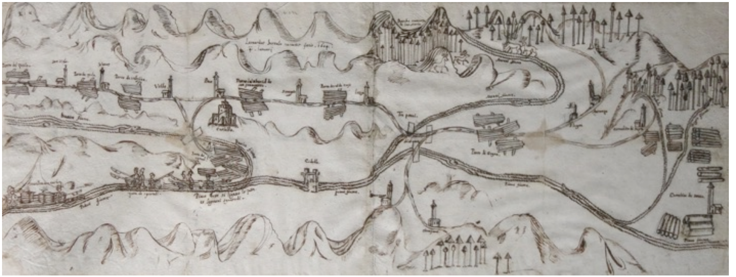
Figura 4. La filiera del legno in Cadore raffigurata da Leonardo Bernabò (1604).