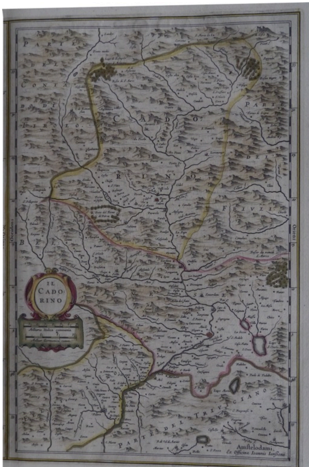
Figura 1. Il Cadorino in una rappresentazione cartografica di inizio Seicento. Fonte: Giovanni Antonio Magini, Il Cadorino (1620), per gentile concessione dell'Archivio digitale cadorino.