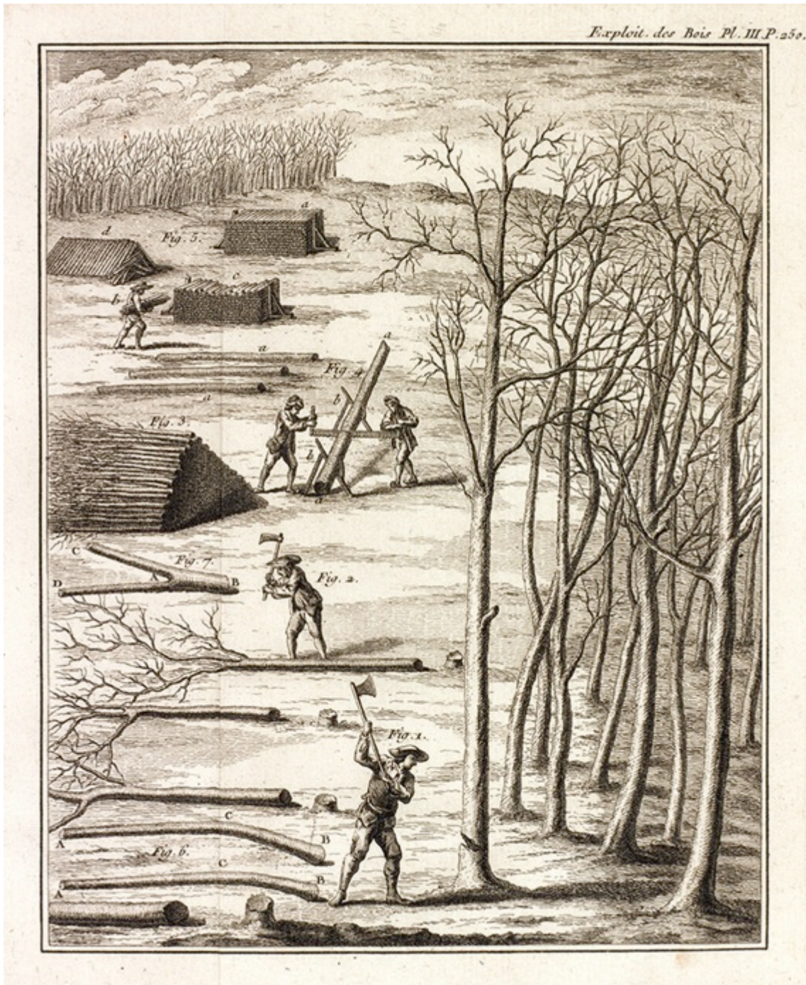
Figura 2. L'attività di taglio nei boschi cedui secondo Henri-Luis Duhamel du Monceau.