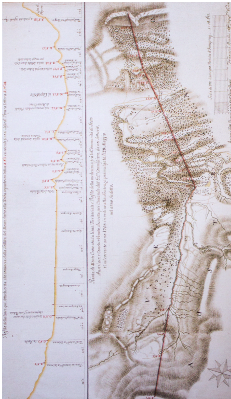
Figura 5. Mappa confinaria del comune di Auronzo, particolare.